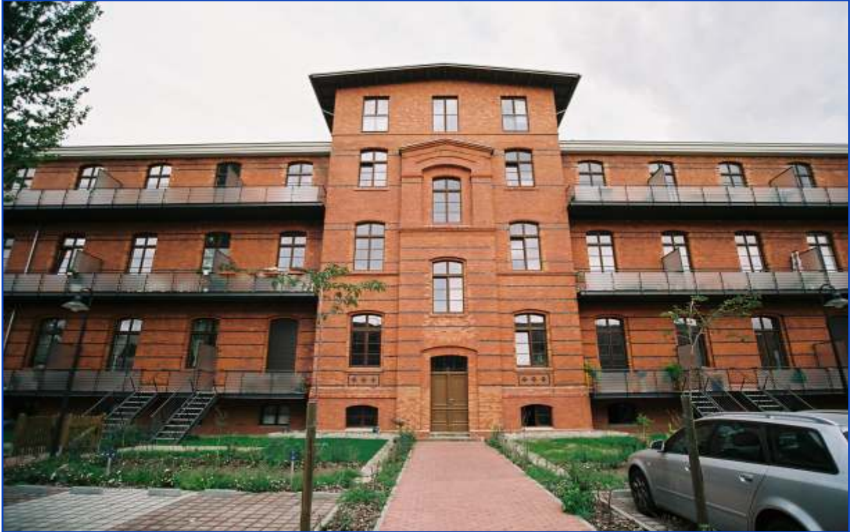
Der "Berlin Campus" an der Spree