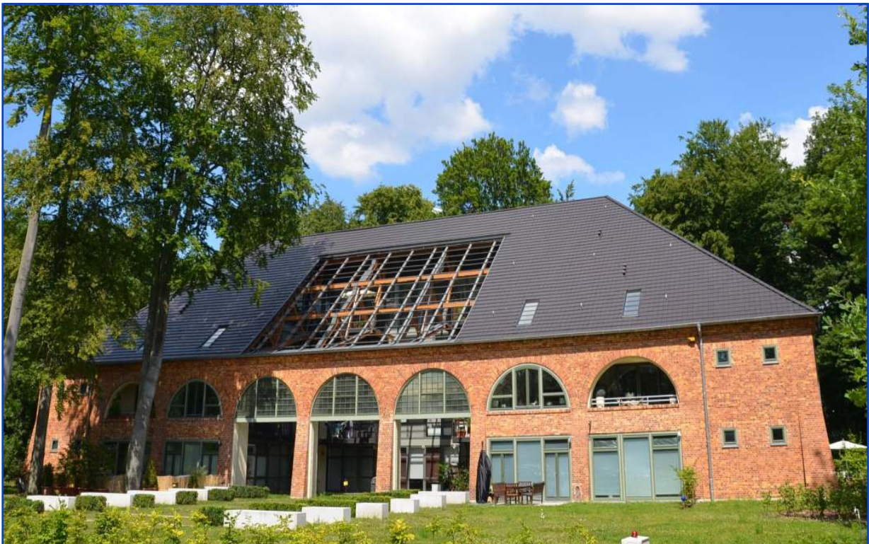
"Les Arcs Leneé" in Potsdam