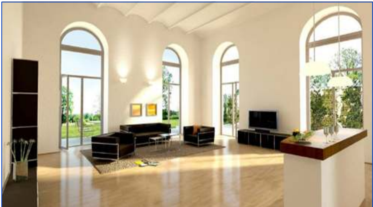
Loftwohnung mit Kappendecken in einer ehemaligen Mälzerei